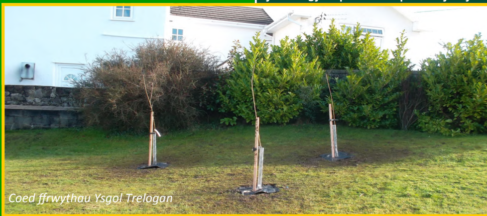
Coed ffrwythau Ysgol Trelogan